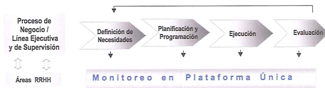
Gráfica Global del Proceso de Gestión del Aprendizaje

Autorizada y Aprobada por la Gerencia General de Nova Austral S.A.