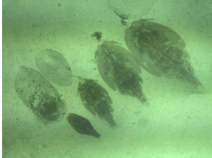
Figura 1. Juveniles: Chalimus I, Chalimus II, Chalimus III y Chalimus IV.