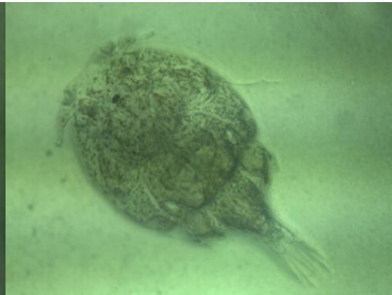
Figura 3. Macho